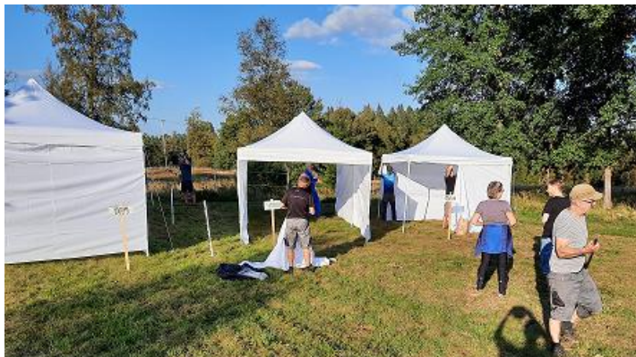
Tält var det här. Nu är vi rustade med flera nya tält. Kul att många var med på detta bygge.

Extra kul att 11 av våra ungdomar passade på att springa. Få erfarenhet och upplevelsen. Ni gjorde det jättebra och hoppas att det gav inspiration till att vara med fler gånger.