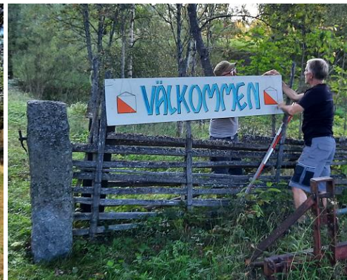
Vilket välkomnande i Tapplarp både som funktionär och tävlande. Skylt ifrån 2003.